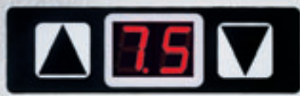
Digitale Voreinstellung der Siegelzeit Digital pre-definition of sealing time Préréglage numérique du temps de scellage